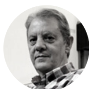
Auditorio Municipal, MEDINA DEL CAMPO Eduardo Velasco