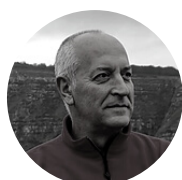
Kultur Etxea, BERRIZ Seve Alava