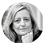
Agencia Andaluza de Instituciones Culturales Isabel Pérez Izquierdo