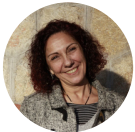
Teatro del Bosque de Móstoles María Sánchez