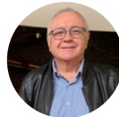
Universitat Jaume I Castelló Antoni Valesa