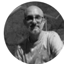
Festival de Teatro Clásico Castillo de Peñíscola Carles Benlliure