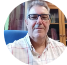
Teatro Cánovas de Málaga Antonio Navajas