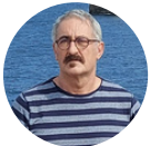
Ayuntamiento de Lezo / Sarea Xanti Val