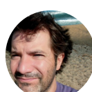
Teatro Francisco Rabal de Pinto